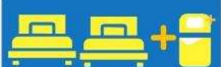
เตียง 3 ท่าน ที่นอนเสริม TRIPLE