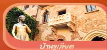
บ้านจูเลียต