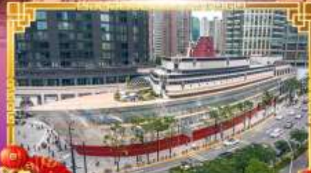
เรือหลุยส์วิคตอง