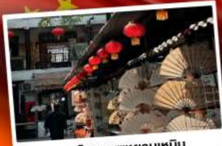
ถนนโบราณซูหยวนเหมิน

"มรดกโลกพันปี สุสานทหารดินเผา" แต่งชุดจีนโบราณ เดินถนนวัฒนธรรมต้าถิง