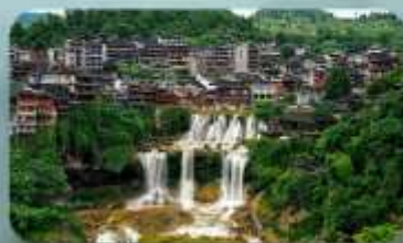
หมู่บ้านฟุหลงเจิ้น