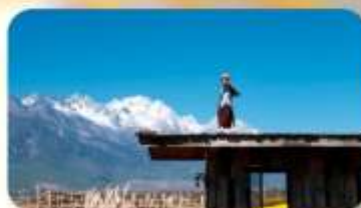
กาแฟ Yun Yi Tang