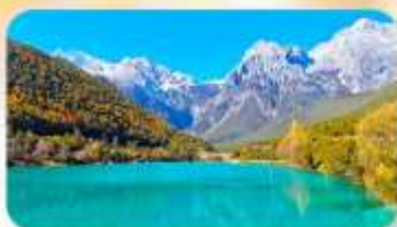
ทะเลสาบไป๋สุยเหอ