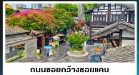
ถนนชอยกวางชอยแคว