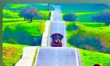
เขานางฟ้า