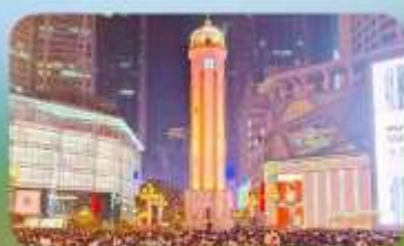
ถนนคนเดินเจียฟางเป่ย์