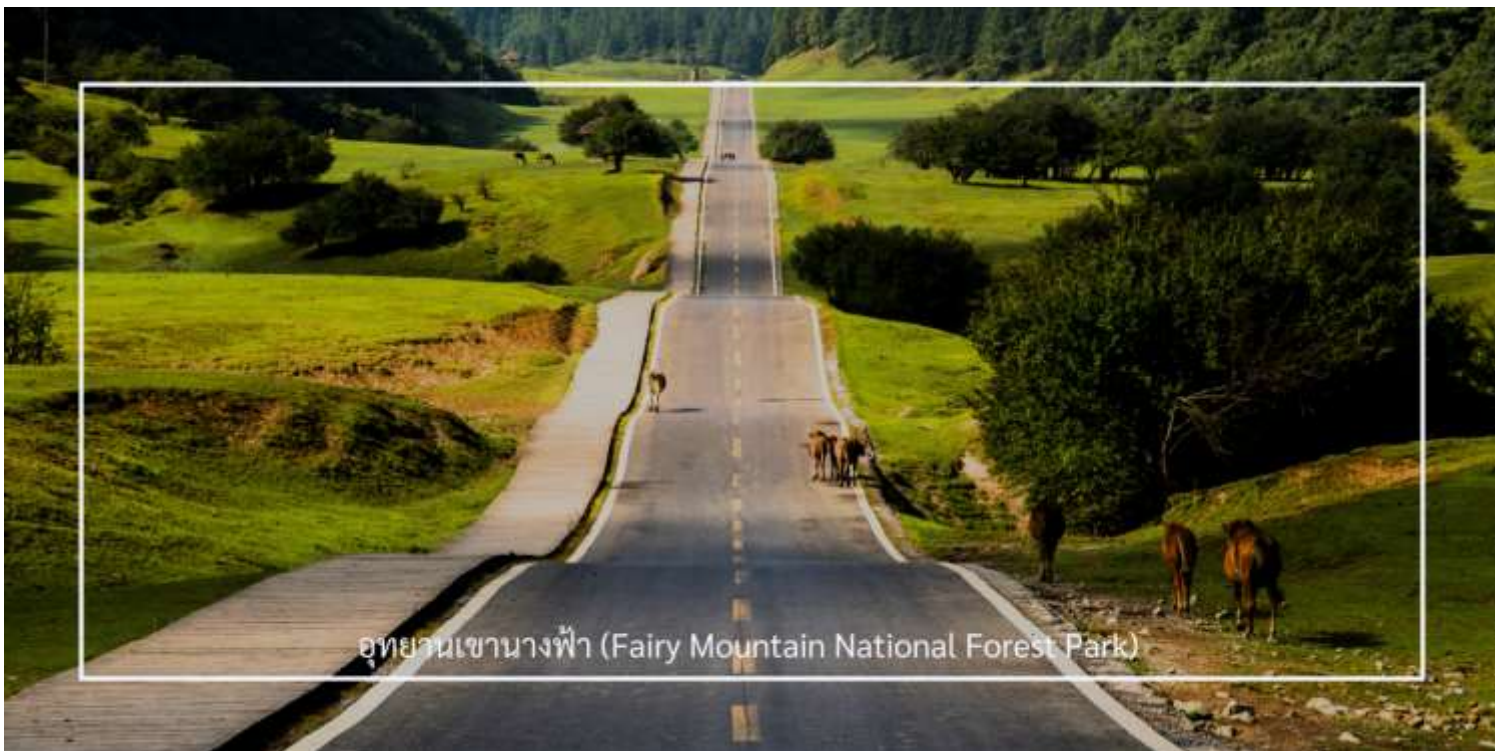
อุทยานเขานางฟ้า (Fairy Mountain National Forest Park)

อุทยานเขานางฟ้า ตั้งอยู่ในเขตอู่หลง มหานครฉงชิ่ง ประเทศจีน เป็นสถานที่ท่องเที่ยวทางธรรมชาติระดับ 5A ของประเทศ โดดเด่นด้วยภูมิประเทศแบบที่ราบสูงอัลไพน์ ปกคลุมด้วยทุ่งหญ้ากว้าง ป่าไม้เขียวขจี และยอดเขาสลับซับซ้อนสวยงามราวภาพวาด ด้วยบรรยากาศเย็นสบายตลอดทั้งปี ที่นี่จึงได้รับฉายาว่า “สวิตเซอร์แลนด์แห่งจีน” อุทยานครอบคลุมพื้นที่กว่า 330 ตารางกิโลเมตร มีระดับความสูงเฉลี่ยกว่า 2,000 เมตรจากระดับน้ำทะเล ภายในท่านสามารถเพลิดเพลินกับการเดินเล่นชมธรรมชาติบน ‘สะพานสวรรค์’ (Glass Skywalk) ชมทิวทัศน์อันงดงามของภูเขาและทะเลหมอก พร้อมบริการรถไฟขบวนเล็ก ที่จะพาท่านชมวิวมกกลางธรรมชาติได้อย่างสะดวกสบาย