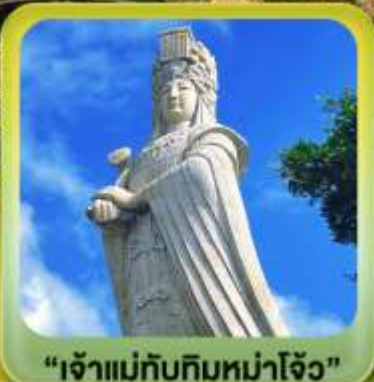
“เจ้าแม่ทับทิมหม่าโจ้ว”