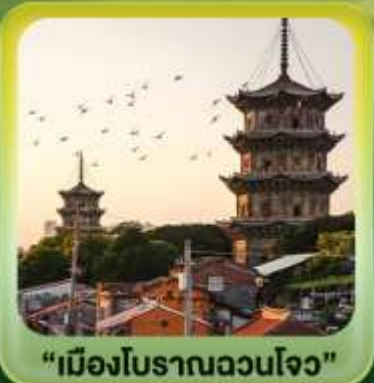
“เมืองโบราณฉวนโจ้ว”