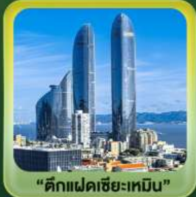
“ตึกแฝดเซี่ยะเหมิน”