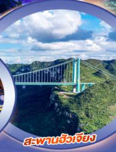
สะพานฮัวเจียง