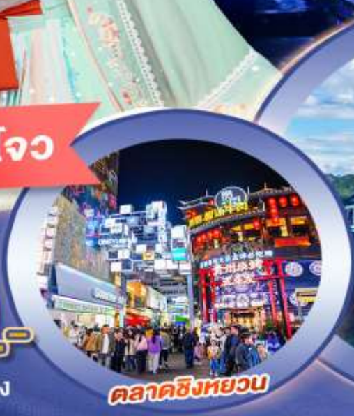
ตลาดซิงหยวน