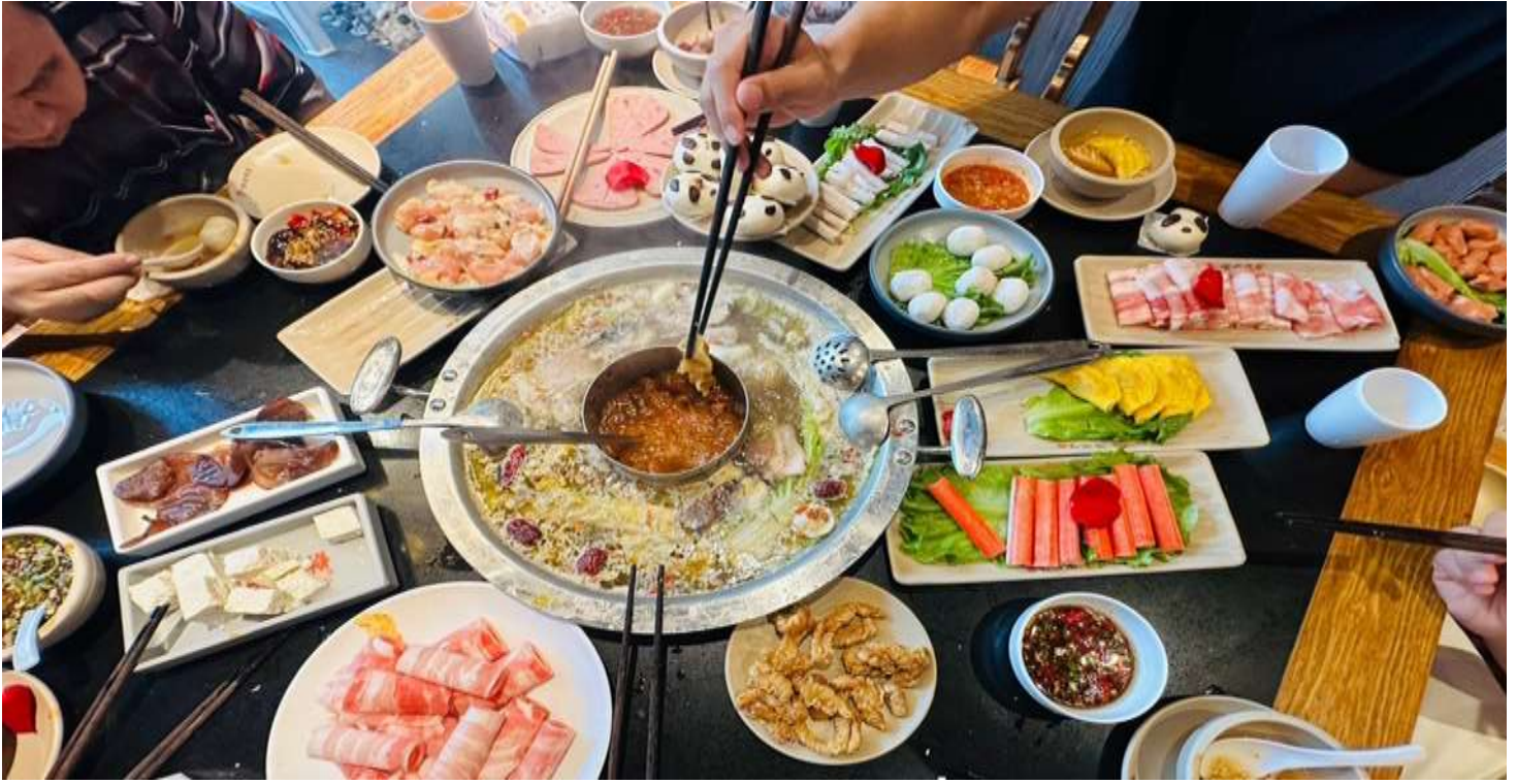
คำ รับประทานอาหารคำ ณ ภัตตาคาร (เมื่อที่ 12) *เมนูพิเศษสุกี้หมाल่าเสวน