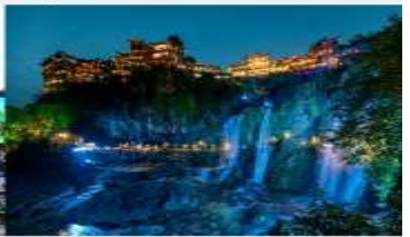
ฟูหรงเจิน

*ทางบริษัทฯ ขอสงวนสิทธิ์ในการสลับโปรแกรมทัวร์ตามความเหมาะสมขึ้นอยู่กับสถานการณ์หน้างาน โดยคำนึงถึงผลประโยชน์ของลูกค้าเป็นสำคัญ