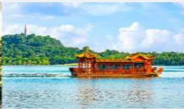
ล่องเรือทะเลสาบหลิวเยว่หู