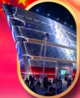
เรือคะหลุยส์