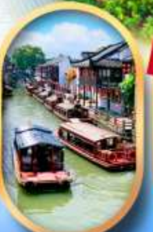
ถนนชานกั๊งเจีย