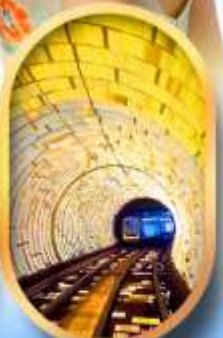
อุโมงค์แม่เหล็ก