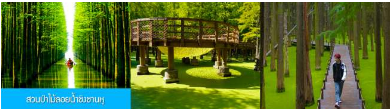
สวนป่าไม้ลอยน้ำชิงซานหู

หลังอาหารเช้าท่านเดินทางโดยรถบัสสู่เมืองหลิงอัน 临安市 (ระยะทาง 175 กม. ใช้เวลาเดินทางราว 2 ชั่วโมงเศษ)