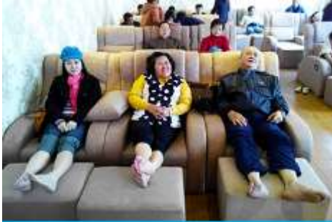
ศูนย์วิจัยแพทย์แผนจีน