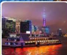
ส่องเรือแม่น้ำหวงผู่