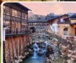
เมืองโบราณเหย้าหู