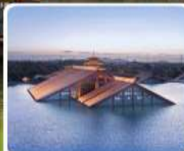
พิพิธภัณฑ์ไดน้ำ กวางฟู่หลิน