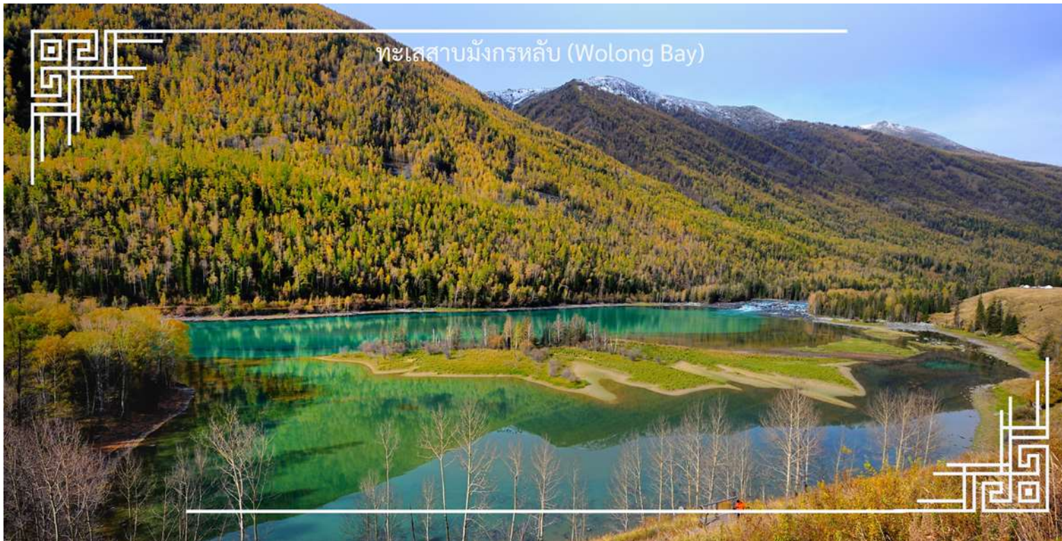
ทะเลสาบมังกรหลับ (Wolong Bay)

จากนั้นนำท่านชม ทะเลสาบเทวดา (Fairy Bay) จุดชมวิวยุคใหม่ที่ตั้งอยู่ทางตอนใต้ของทะเลสาบคานาสีอ ภายในเขตโดดเด่นด้วยผืนน้ำใสสะท้อนเงาภูเขาและผืนป่า สร้างบรรยากาศราวดินแดนในเทพนิยาย สถานที่แห่งนี้มีชื่อเรียกตามตำนานท้องถิ่นว่า “อ่าวของเหล่าเซียน” โดยเล่าขานกันว่าเป็นสถานที่ที่เหล่าเทพเซียนลงมาเล่นน้ำ จึงยิ่งเพิ่มเสน่ห์และความลึกลับให้กับทัศนียภาพอันงดงาม