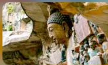
ฆาตินแกะสลักต้าจู้