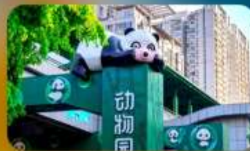
สถานีหมี่แพนด้า