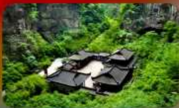
อุทยานหลุมพี้