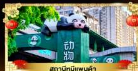
สถานีหมีแพนด้า