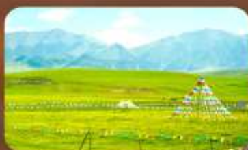
ทุ่งหญ้าออร์คอส