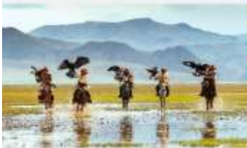
ชมฝูงอูฐมองโกเลีย