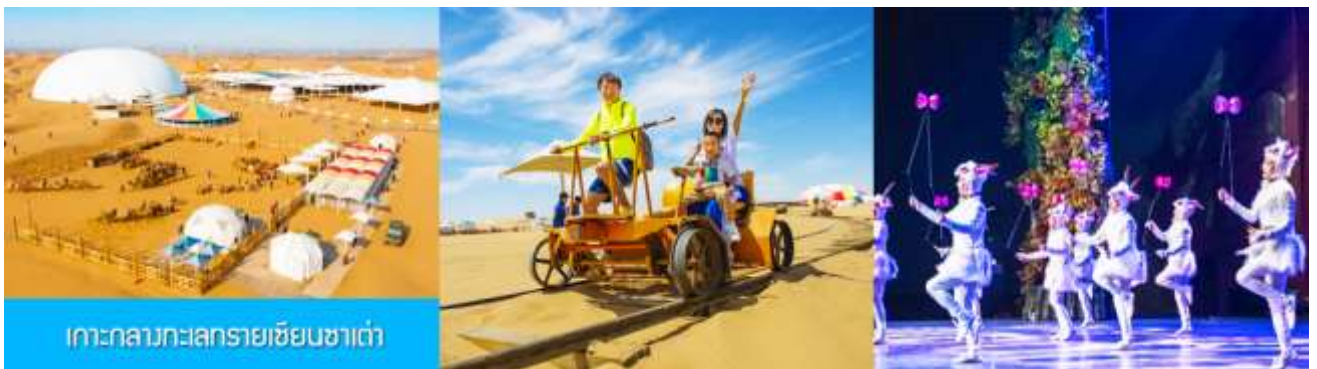
เกาะกลางทะเลทรายเขียนซาเต่า