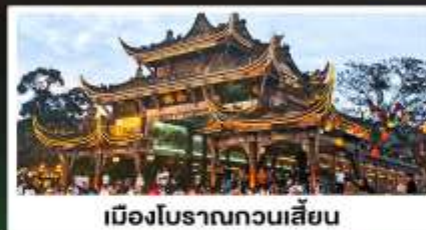
เมืองโบราณทวนเสียน