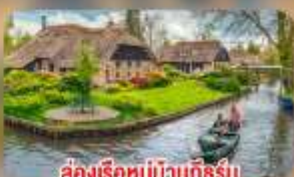
สองเรือหมู่บ้านทึร์น