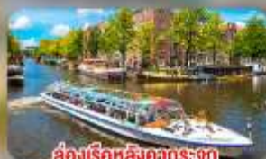
สองเรือหลังคากระจก