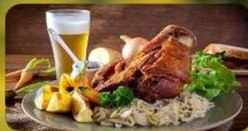
พิเศษ! ลิ้มลองเมนูประจำชาติ ทั้ง 5 ประเทศ!!!