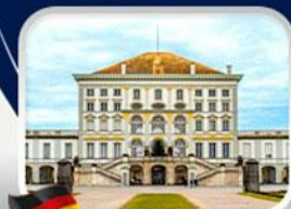
พระราชวังนิมเฟนบวร์ก