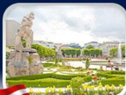
สวนมิราเบล ซาลซ์บวร์ก