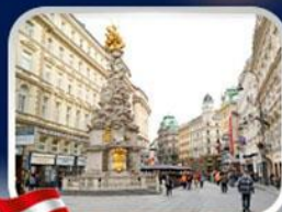
ซ็อบบิวการ์ทเนอร์สตรีก