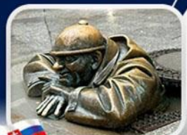
ประติมากรรม Cumil

มาเรียนพลาทซ์ • บ้านเกิดโมซาร์ท • พระราชวังฮอฟบวร์ก • ซาลส์บวร์ก • บ้านเกิดโมซาร์ท • เกรโกเดร์สตรีก • ทะเลสาบคอนิกซ์ • หมู่บ้านอัลส์สตัดท์ • อนุสาวรีย์มาเรียเทเรซา