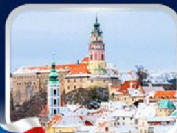
เมืองเซสกี คลุมลอฟ