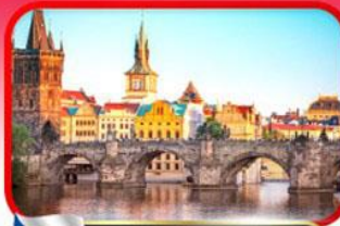
เขื่อนอินสพานชาร์ลส์