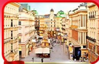
ย่านคาร์กเนออสตรีก