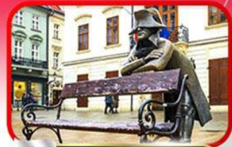
ย่านเมืองเก่าราติสลาวา

เที่ยวเมืองสวยริมทะเลสาบ ฮัลล์สตัดท์ • ชมเมืองไข่มุกแห่งโบฮีเมีย เซสกี กรุงลอน • ปราก • เวียนนา • ซอปปิงพาร์นดอร์ฟ เอาก์เล็ท