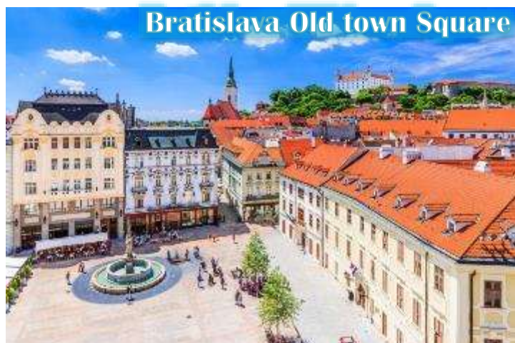
Bratislava Old town Square

บ่าย นำท่านเดินทางสู่กรุงบราติสลาวา, ประเทศสโลวัก นำท่านเข้าชมเมืองเก่าบราติสลาวา สัมผัสบรรยากาศเมืองเก่า และถ่ายภาพกับโรงละครโอเปร่า สัญลักษณ์แห่งความหรรษาของประเทศ และเก็บภาพรูปปั้นที่ซ่อนอยู่ในตัวเมือง ไม่ว่าจะเป็นรูปปั้นโปเลียนหน้าสถานทูตฝรั่งเศส หรือรูปปั้นปาปาริซซ์รวมถึง ไฮไลต์ของเมืองคือรูปปั้นของคนที่ตกท่อคูมิล” (Man at Work) ที่โด่งดัง ณ แห่งนี้เคยถูกรถชนมาแล้วถึง 2 ครั้ง ในปัจจุบันจึงมีป้าย เขียนว่า “Man at Work” ปักอยู่บริเวณดังกล่าว เป็นสัญลักษณ์ช่วงที่เป็นคอมมิวนิสต์ และตำนานยังคงเล่าต่อไปว่าอาจจะเป็นคุณลุงที่เหน็ดเหนื่อยกับการทำงานอยากจะพักผ่อนบ้างตามประสานักงานหนัก จากนั้นนำท่านชม “ประตูไมเคิล” ซึ่งซุ้มประตูไมเคิลก่อสร้างสไตล์โกธิคสูง 51 เมตร มีอยู่ทั้งหมด 4 แห่ง ปัจจุบันเป็น ประตูเพียงแห่งเดียวที่ยังเหลืออยู่ ประตูไมเคิลมียอดโดมทรงหัวหอมตามศิลปะบารอก 3 ชั้น ลดหลั่นกัน ประตูแห่งนี้ตั้งอย่างศูนย์กลางเมืองเก่า สองฝั่งถนนมีอาคารเก่าแก่หลาก สี สัน สไตล์อาร์ตนูโวตั้งเรียงรายอยู่ทำให้บรรยากาศคึกคัก