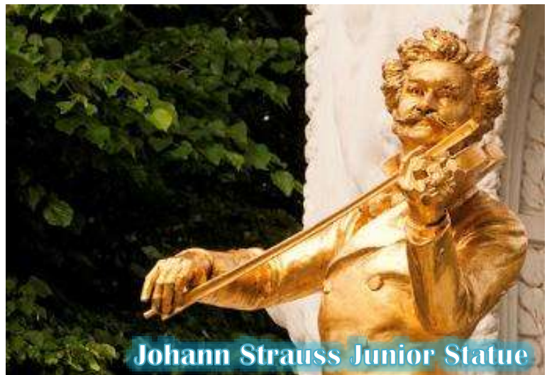
Johann Strauss Junior Statue

เช้า บริการอาหารเช้า ณ ห้องอาหารของโรงแรม นำท่านออกเดินทางเข้าสู่ใจกลาง “กรุง เวียนนา” (Vienna) ผ่าน “ถนนวงแหวน” Ring Strasse ซึ่งเป็นที่ตั้งของ โรง อوبرาการ์ (โอเปร่าเฮาส์), พระราชวังฮอฟบวร์ก, อาคาร รัฐสภา, ศาลาว่าการ, มหาวิทยาลัยเวียนนา, โบสถ์ประจำเมือง, ศาลสูง ฯลฯ เดินทางสู่ “สวนสาธารณะสตัดปาร์ค” สวนสาธารณะอัน ร่มรื่นใจกลางเมือง ชม “ อนุสาวรีย์ โยฮันเนส รัส อูเนียร์ ” Johann Strauss ศิลปินที่มี ชื่อเสียงก้องโลก