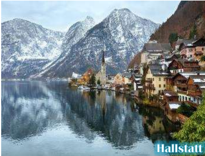
Hallstatt View point

*** บริษัทฯ ขอสงวนสิทธิ์ในการย้ายโรงแรมที่พักไปยังเมืองเซนต์วูล์ฟแก็ง หรือ เซนต์กิลเกน (ริมทะเลสาบ) แทน ในกรณีโรงแรมในหมู่บ้านฮัลล์สตัดท์เต็ม ***