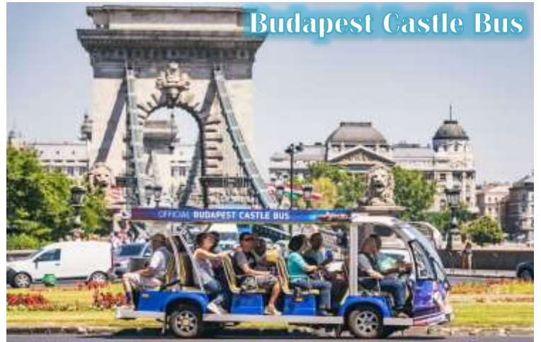
Budapest Castle Bus

บูดา Castle Hill *เนื่องจากตัวปราสาทตั้งอยู่บนเนินเขา การเดินทางโดยรถไฟไฟฟ้า จะเพิ่มความสะดวกสบายให้กับท่าน โดยรถไฟไฟฟ้าจะจอดรับและส่งตามจุดต่างๆ ในย่านเมืองเก่า ไม่ต้องเดินเท้าเป็นระยะทางไกล* จากนั้นนำท่านเดินชมความงดงามของเมืองเก่ารอบๆปราสาทบูดา ที่เริ่มมีการก่อสร้างมาตั้งแต่ปี ค.ศ.1265 และต่อเติมปรับปรุงมาโดยตลอด จนกระทั่งปัจจุบัน โดยตัวอาคารในปัจจุบันเราจะเห็นเป็นสไตล์บาโรค ที่ดู