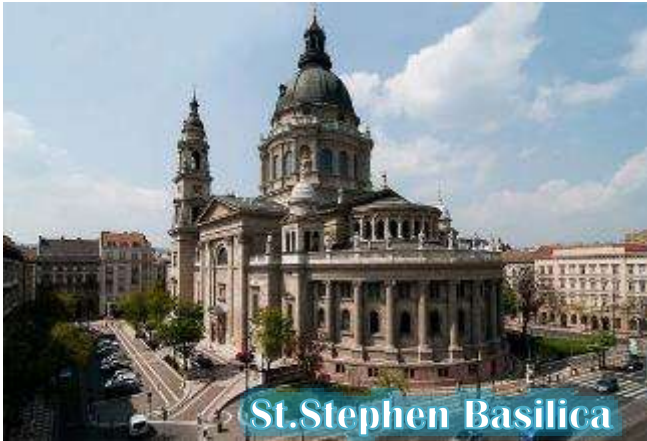
St. Stephen Basilica