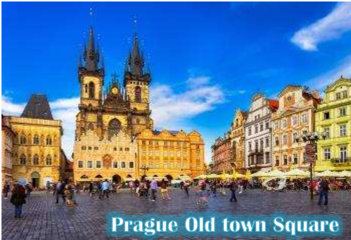
Prague Old town Square