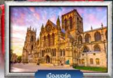
เมืองยอร์ก