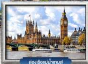
ล่องเรือแม่น้ำเทส