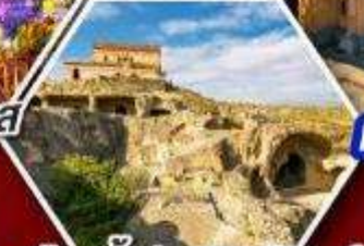
เมืองถ้ำอพิลิสต์ซิคห์

แพคเกจ Rooms Hotel โรงแรมวิวทิวทัศน์ของเทือกเขาคอเคซัส