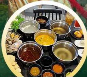
ซาบู่ฮ่องกง

02-04 มิ.ย. 18-20 มิ.ย. 07-09 มิ.ย. 20-22 มิ.ย. 13-15 มิ.ย. 25-27 มิ.ย. 14-16 มิ.ย. 28-30 มิ.ย.