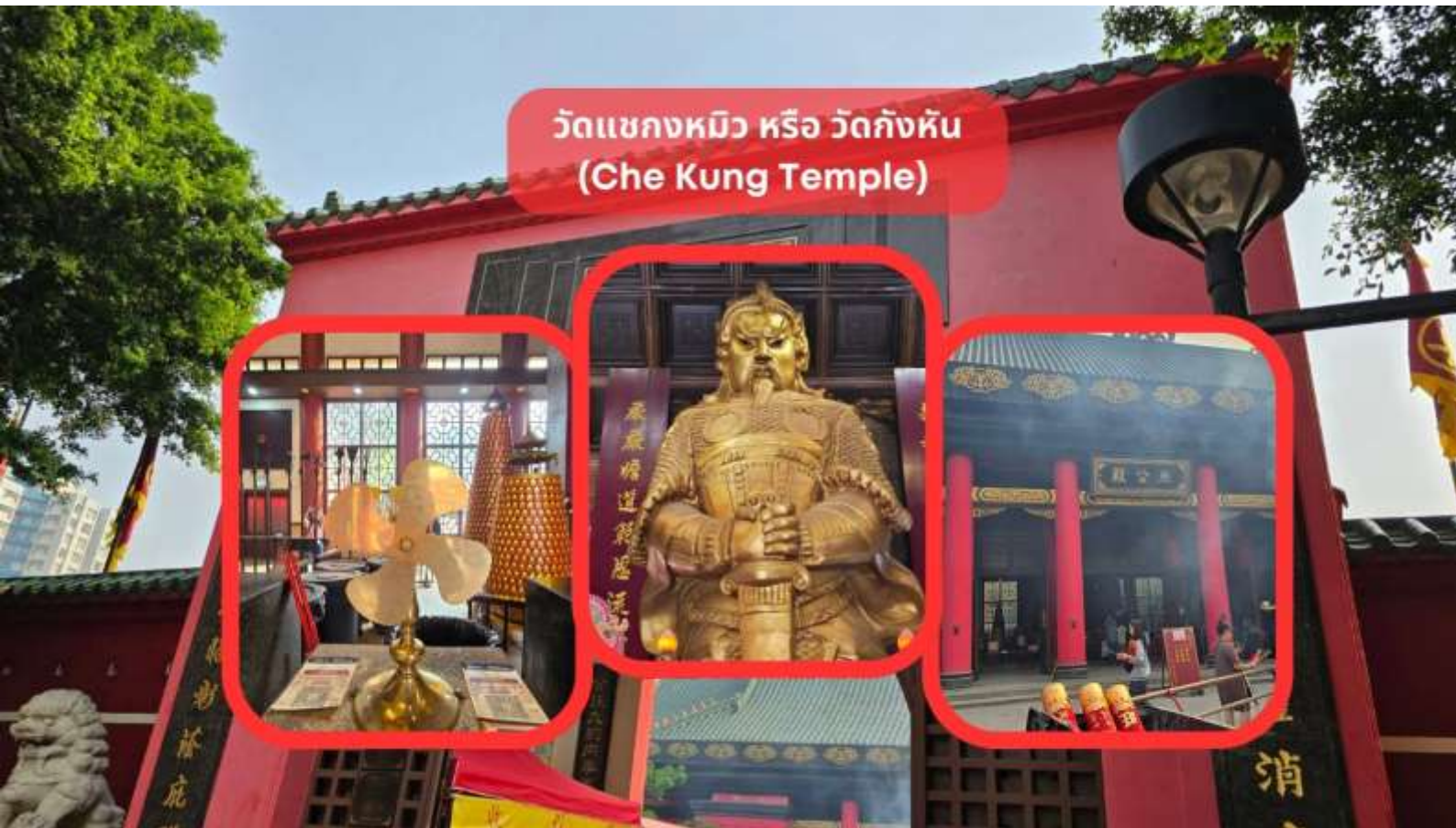
วัดแกงหมิว หรือ วัดกัณฑ์ (Che Kung Temple)

นำท่านเดินทางสู่ วัดแกงหมิว หรือ วัดกัณฑ์ (Che Kung Temple) ขอพรเรื่องการเดินทางปลอดภัย สุขภาพแข็งแรง โชคลาภ และเงินทอง วัดตั้งฮ่องกงที่ตั้งมาถึงเมืองไทย เป็นวัดที่มีประวัติศาสตร์ยาวนานกว่า 300 ปี ภายในวัดมีรูปปั้นสีทองเหลืองอร่าม ตั้งตระหง่านทั้งชายและขวา เป็นวัดศักดิ์สิทธิ์ที่มีความเชื่อในเรื่องกัณฑ์ลม โดยความหมายของใบพัดทั้ง 4 คือ เดินทางปลอดภัย อายุยืนยาว เงินทองไหลมาเทมา และสมปรารถนาทุกประการ หากหมุนกัณฑ์ตามเข็มนาฬิกา 3 รอบ จะพัดพาเอาสิ่งไม่ดีออกชีวิต และนำสิ่งดีๆ เข้ามาแทน