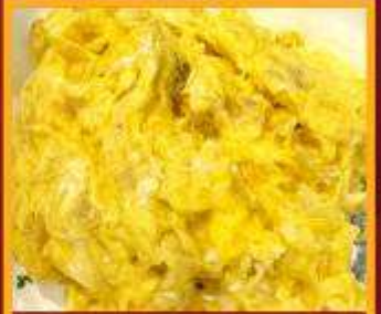
ไข่เจียวทรงเครื่อง