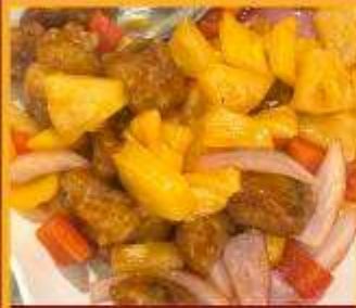
กระดุกหมูผัดเปรี้ยวหวาน