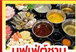
บุฟเฟ่ต์ซาบู