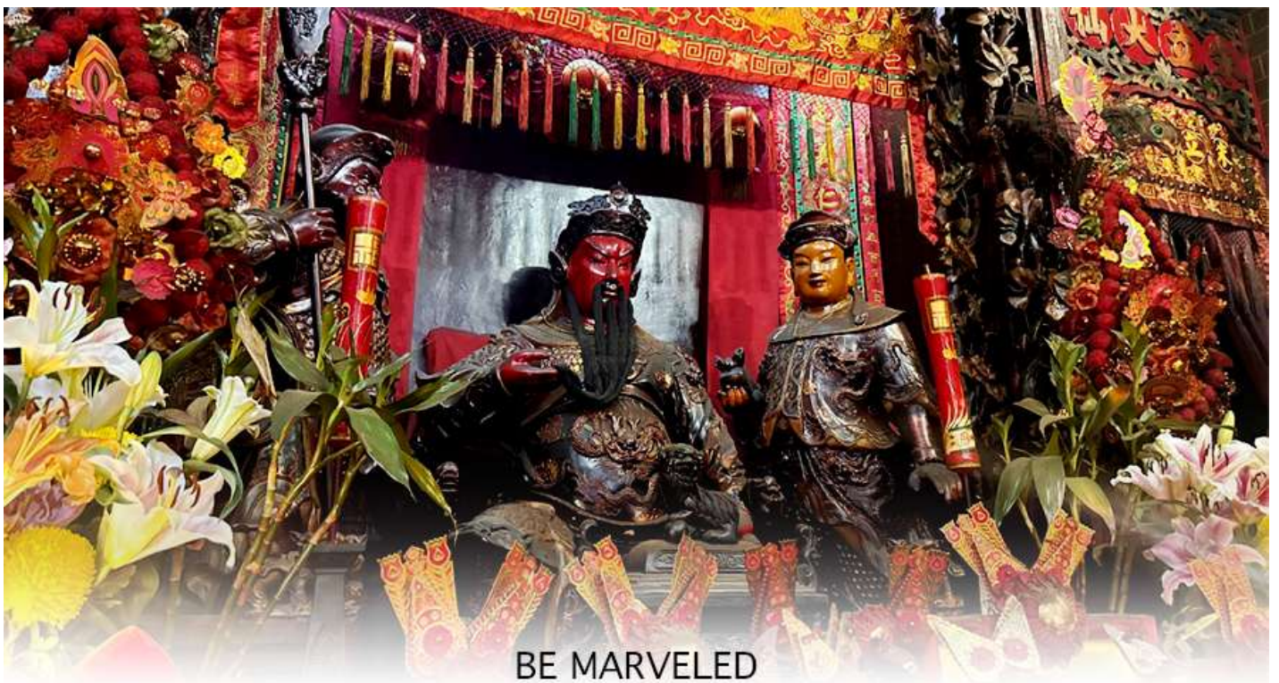
BE MARVELED วัดกวนอู

เจ้าแม่ทับทิม หรือ เทพธิดาแห่งท้องทะเล ซึ่งทำหน้าที่ปกป้องคุ้มครองชาวประมง ตั้งโดดเด่นอยู่ท่ามกลางสวนสวยที่ทอดยาวลงสู่ชายหาดให้ท่านนมัสการขอ และนำท่านเดินข้าม สะพานต่ออายุ ซึ่งเชื่อกันว่าข้ามหนึ่งครั้งจะมีอายุเพิ่มขึ้น 3 ถ้าข้ามแล้วห้ามเดินย้อนกลับไปเด็ดขาด เพราะคนฮ่องกงเชื่อว่าชีวิตจะสั้นลงไป 3 ปี สำหรับคนโสดจะนิยมขอพรกับ เทพเจ้าแห่งความรัก ให้เอามือลูบที่บริเวณหินสีดำ พร้อมกับอธิษฐานให้สมหวังกับความรัก ปิดท้ายด้วยการรับพลังฮวงจุ้ยจาก ศาลา แปรทิศ ซึ่งถือเป็นจุดรวมรับพลัง ถือเป็นจุดที่มีฮวงจุ้ยดีที่สุดในเกาะฮ่องกง และยังมีรูปปั้นองค์เทพอีกมากมายภายในวัดแห่งนี้ให้กราบไหว้ขอพร