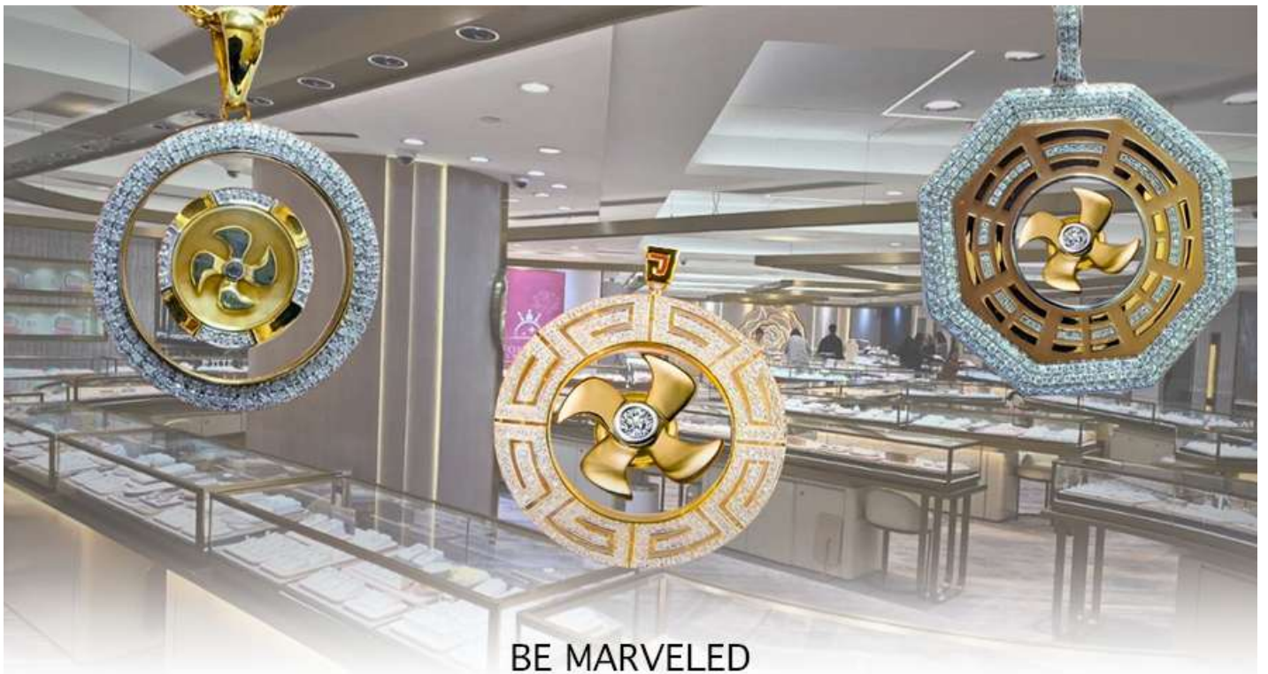
BE MARVELED ศูนย์ฮวงจุ้ย กังหันเศรษฐี

นำท่านชม ศูนย์ฮวงจุ้ย กังหันเศรษฐี ที่ขึ้นชื่อของฮ่องกง ท่านจะได้พบกับงานดีไซน์ที่ได้รับรางวัลยอดเยี่ยม และใช้ในการเสริมดวงเรื่องฮวงจุ้ย โดยการย่อใบพัดของกังหันที่เป็นสัญลักษณ์ของวัตต์แดงหงมิว มาทำเป็นเครื่องประดับ ไม่ว่าจะเป็นจี้, แหวน, กำไล หรือต่างหูเพื่อเป็นเครื่องประดับติดตัว และเสริมดวงชะตา ซึ่งสินค้าทุกชิ้นนี้ มีเอกสาร รับประกันคุณภาพเปลี่ยนหรือ ซ่อม ได้ตลอดอายุการใช้งาน หากเกิดการชำรุดจากสินค้าไม่ใช่อุบัติเหตุ