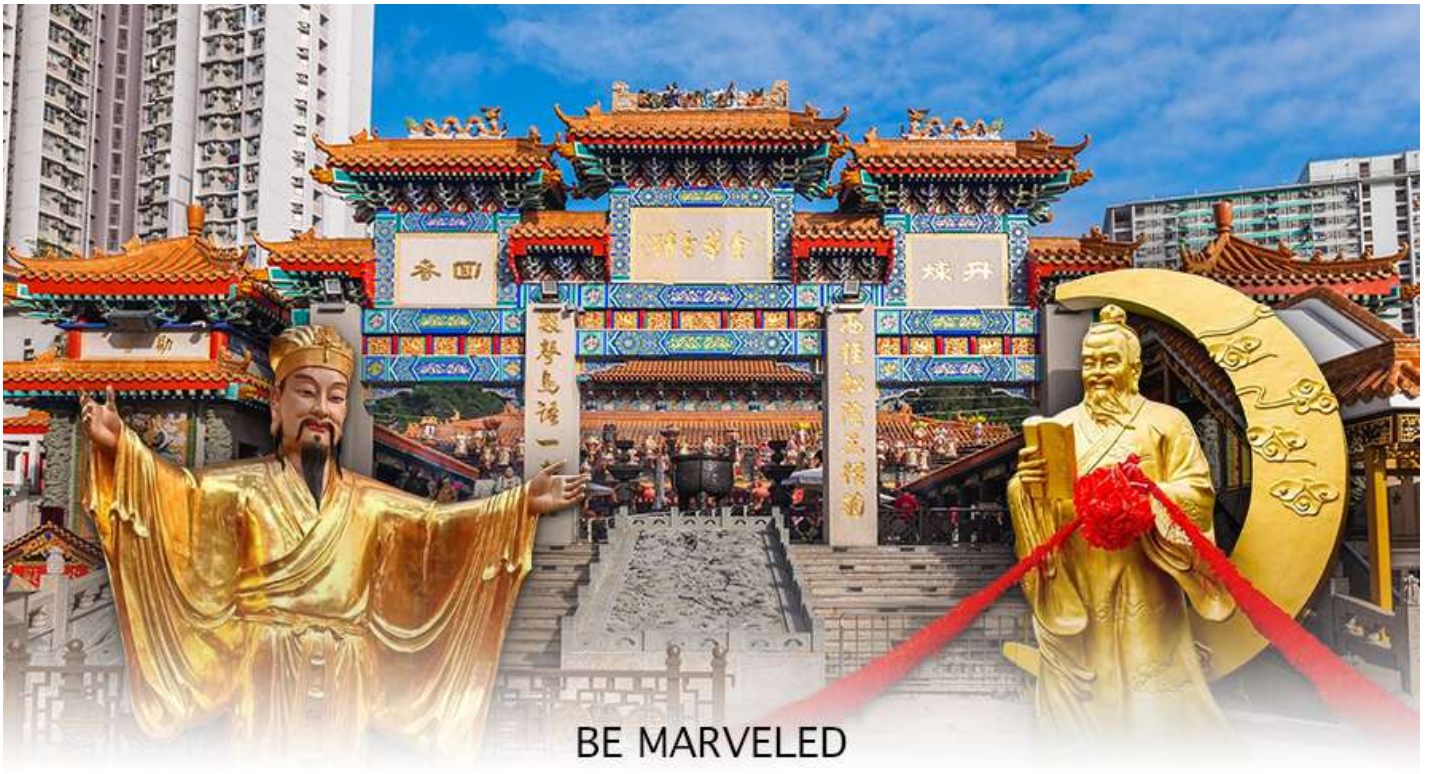
BE MARVELED วัดหวังต้าเซียน

จะพบรูปปั้นเจ้าบ่าว อยู่ทางขวา และรูปปั้นเจ้าสาวอยู่ทางซ้าย โดยมีด้ายแดงผูกโยงจากเจ้าบ่าวและเจ้าสาวมาที่เทพหยุกโหลว ซึ่งท่านจะคอยทำหน้าที่จกราชชื่อคู่รัก เชื่อกันว่าสมมุติที่ผู้เฒ่าถือในมือ คือบัญชีรายชื่อคู่รักที่จะได้รับคำอวยพรให้อยู่คู่กันอย่างร่มเย็นเป็นสุข ซึ่งจะปรากฏตัวยามค่ำคืนภายใต้แสงจันทร์ เป็นเทพเจ้าผู้เป็นอมตะที่อาศัยอยู่บนดวงจันทร์ และลงมาโลกมนุษย์ เพื่อผูกด้ายดวงชะตา ระหว่างคู่รักซึ่งเมื่อคู่กันแล้วก็จะไม่แคล้วคลาดกัน และมีความรักที่มั่นคงและยืนยาว