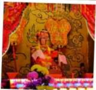
เจ้าแม่กัปกิม จอสเฮาส์เบย์