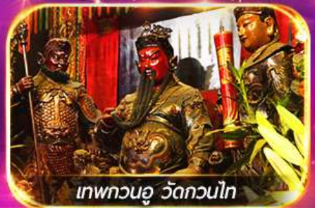
เทพทวนอู วัดกวนไท

พามูไหว้พระขอพร 8 วัดดัง เล่นเครื่องเล่นดิสนีย์แลนด์เต็มวัน ชมพลุสุดอลังการ