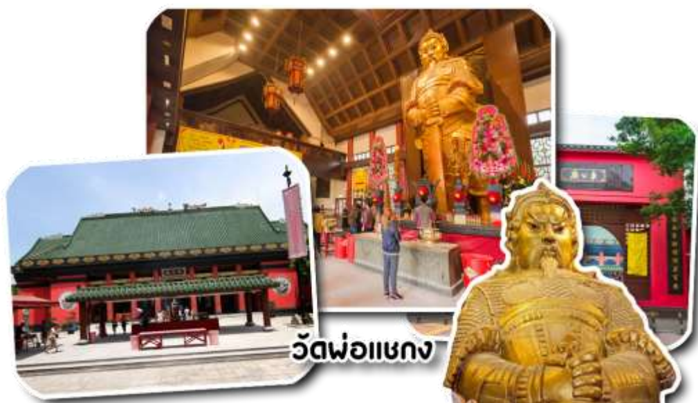
วัดพ่อแซกง

ฮ่องกงให้ความเลื่อมใส่ศรัทธามาเนิ่นนาน สร้างขึ้นเพื่อระลึกถึง ตำนานนักรบแห่งราชวงศ์ซ่ง เทพเจ้าแซกง แม่ทัพปราบศึกที่กล้าหาญ ในกองทัพของท่านยามที่ออกรบเพื่อดำเนินศึกศัตรูทุกทิศทาง ทุกๆครั้งท่านจะใช้สัญลักษณ์รูป