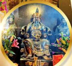
วัดปึกโต

เสริมโชคลาภนำความรุ่งเรือง ทุกด้านของชีวิต