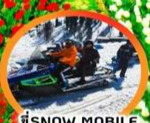
ขี่ SNOW MOBILE