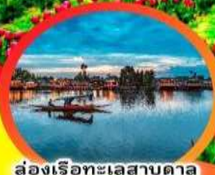
ล่องเรือทะเลสาบดาล