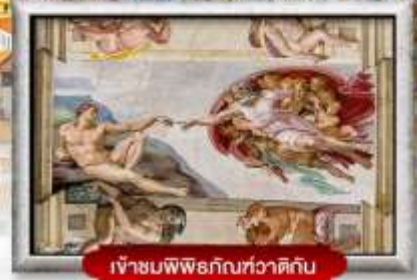
เข้าชมพิพิธภัณฑ์ทวารดิกัน