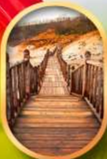
หุบเขาจิกุกุคานิ