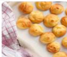
ร้าน KITAKARO ซึ่งเป็นขนมอบจากเตาสดๆ ที่เมื่อก่อนจะขายกันเฉพาะที่เมืองโอตารุและขณะนี้ก็จะจัดส่งมาทั้งเมืองฮอกไกโด