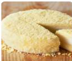
ร้าน LeTAO ร้านนี้มีเค้กแสนอร่อย ด้วยบรรยากาศที่ร้านตกแต่งด้วยไม้ที่แสนอบอุ่น อีกทั้งยังมีเค้กแสนอร่อยแบบโฮมเมดอีกด้วย