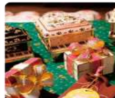
กล่องดนตรี MUSIC BOX