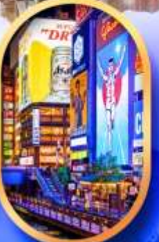
ย่านชิบะฮาชิ