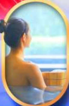
พักโรงแรมออนเซ็น