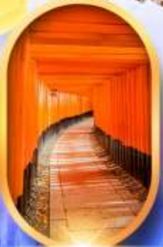
เมืองเก่าทาคายาม่า