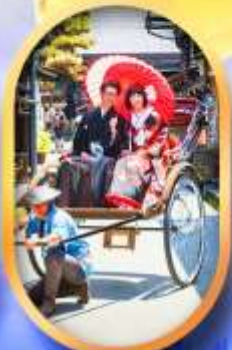
ศาลเจ้าจิ้งจอก