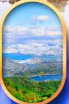
ทะเลสาบมิกะตะ