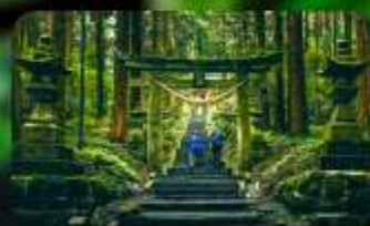
ศาลเจ้าคามิซึกิมิ