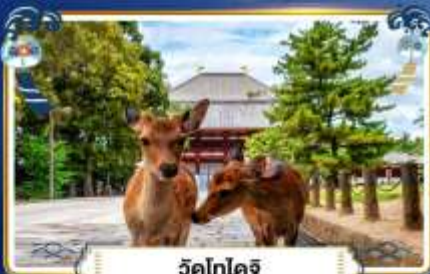
วัดโทไดจิ