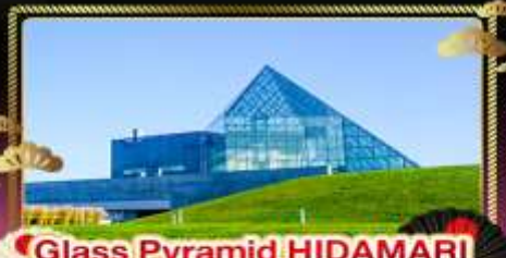
• Glass Pyramid HIDAMARI