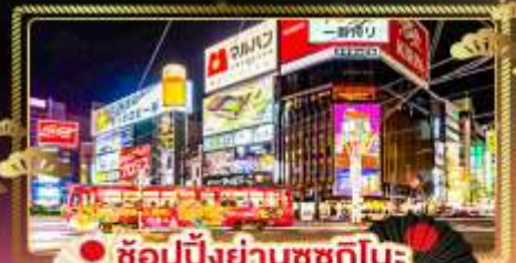
• ช้อปปิ้งย่านซุกุชิโนะ