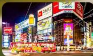
ซุปป์ิงย่านซูซุกิโนะ