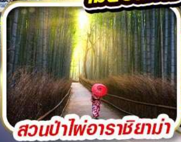
สวนป่าไฟอาราชิยาม่า