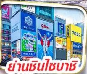
ย่านชินไซบาชิ