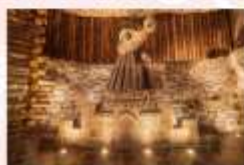
เหมืองเกลือวิลิชก้า