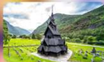
Unseen ไนท์ Borgund Stave Church