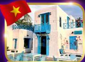
คาเฟ่สุดชิค ซานทรา มาริน่า